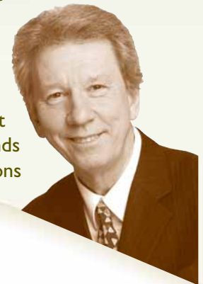
Jean-Pierre Blackburn Ministre du Travail et ministre de Développement économique Canada

Dans cet esprit, l'Agence de développement économique du Canada pour les régions du Québec a également créé, en collaboration avec les SADC et les CAE, le Fonds de capitalisation pour la relève en entreprise et le Fonds de capital de risque pour le démarrage d'entreprises en région. Dotés d'une enveloppe budgétaire de 13 millions de dollars, avec un effet de levier de plus de 50 millions de dollars, ces fonds sont destinés à diversifier l'économie des régions vulnérables.