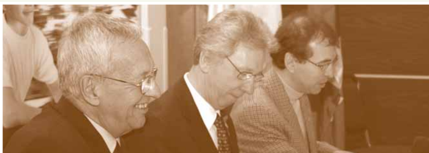
Conférence de presse, Alma.

De ce nouveau partenariat, il faut principalement retenir la grande souplesse d'utilisation des enveloppes budgétaires. Cette caractéristique prend sa source dans la raison d'être du Programme de développement des collectivités, soit de permettre de gérer les fonds pour et par le milieu.