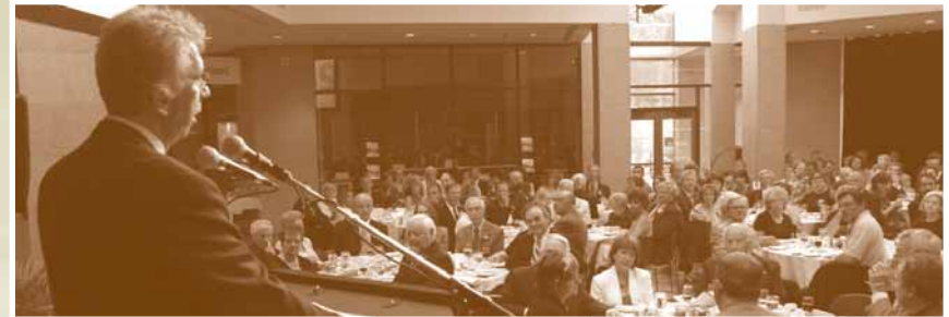
L'honorable Jean-Pierre Blackburn lors de son allocution.

Ces deux événements ont été commémorés le 16 juin 2006, lors d'une soirée à Québec au cours de laquelle divers témoignages d'artisans de la première heure du PDC ont été offerts à l'auditoire nombreux.