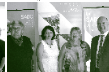
Témiscouata, Kamouraska et Rivière-du-Loup