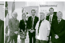
Charlevoix et Portneuf