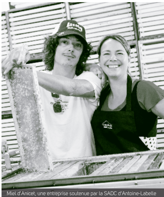
Miel d'Anicet, une entreprise soutenue par la SADC d'Antoine-Labelle

Un sixième rapport de Statistique Canada a été produit afin d'évaluer l'impact sur la performance des entreprises du Programme de développement des collectivités (PDC), livré par les SADC et CAE au Québec. C'est sans surprise que ces évaluations annuelles confirment la constance de l'apport supplémentaire qui découle de notre soutien aux entreprises.