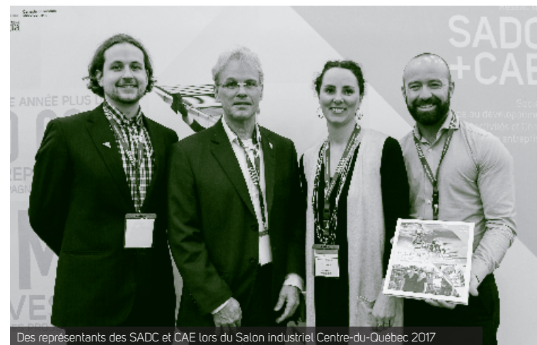
Des représentants des SADC et CAE lors du Salon industriel Centre-du-Québec 2017

Consultez le calendrier des prochains salons en région au promopageau.com