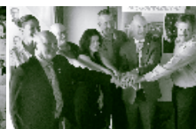
Matane, La Mitis, Matapédia