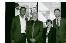
Le Réseau et l'Outaouais