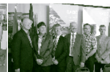
Rimouski et Les Basques