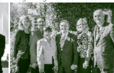
Le Réseau et la Mauricie avec l'ajout du lancement de l'initiative Soutien aux petites entreprises